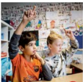
UKE 6 GRUNNMATERIELL TIL UNDERVISNING OM SEKSUALITET 1.-4. TRINN SEX:POLITIKK

TEMAMATERIELL RETTA MOT 1.–4. TRINN, 7.–8. TRINN OG 9.–10. TRINN «Sosiale medium» fokuserer på trivsel i sosiale medium, førebygging av krenkingar på nettet og personvern.