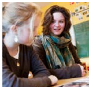
UKE 6 GRUNNMATERIELL TIL UNDERVISNING OM SEKSUALITET 5.-7. TRINN SEX:POLITIKK