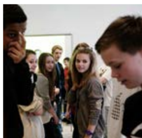
VEKE 6 GRUNNMATERIELL TIL UNDERVISNING OM SEKSUALITET 8.-10. TRINN SEX:POLITIKK