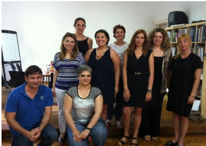
I'M SET, Kypros 2014