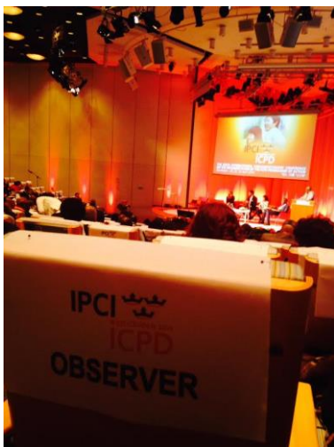
Sex og Politikk var observatør på konferansen.