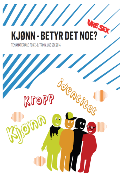
Temamateriell 2014 for 7.-8. trinn

I 2014 registrerte mer enn 800 undervisere seg for å motta gratis materiell til undervisning om seksualitet i grunnskolens 7.-10. klassetrinn. De oppga at 60 000 skulle få undervisning fra «Uke 6, 2014». Tema for kampanjen i 2014 var kjønn og likestilling og kampanjen tilbød eget temamateriell, «Kjønn, betyr det noe+», basert på materiell fra den danske kampanjen «Uge Sex». Flere bidro med gode faglige innspill under utviklingen og bearbeidelsen av temamateriellet, fra Sex & Samfund i Danmark, LLHs Rosa Kompetanse, Reform, Likestillingssenteret på Hamar, Harry Benjamin Ressurssenter og LHBT-senteret. I tillegg jobbet mange ungdommer med oss på Operasjon Dagsverk, for å gi innspill til både språk og øvelser i materiellet. «Uke 6, 2014» mottok tilskudd fra Helsedirektoratet, Utdanningsdirektoratet og Barne-, ungdoms- og familiedirektoratet.