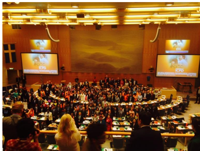
Deltakerne på IPCI ICPD på svenske Riksdagen.