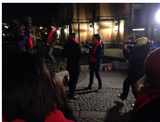
TV 2 var til stede for hivsløyging av statuen av Wenche Foss tidlig om morgenen 1. desember.

Verdens aidsdag markeres verden over, og Norge er, tross alt, et land med relativt liten forekomst av hiv. Verdens helseorganisasjon (WHO) melder om at totalt 39 millioner mennesker har mistet livet som følge av hiv. 70 % av de nye hivsmittede i verden bor i Afrika sør for Sahara, hvor tilgang til informasjon, helsetjenester og beskyttelse ofte er mangelfull. I tillegg beregner WHO at smitte blant unge i alderen 15-19 er på vei opp, særlig i Afrika.