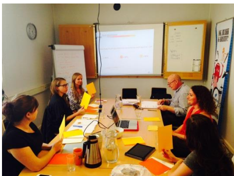
Møte med Ungdomsnettverket på hiv/aids.

20. og 21. mai var Sex og Politikk partnere IAVI – International AIDS Vaccine Initiative og IPM – International Partnership for Microbicides på besøk i Oslo.