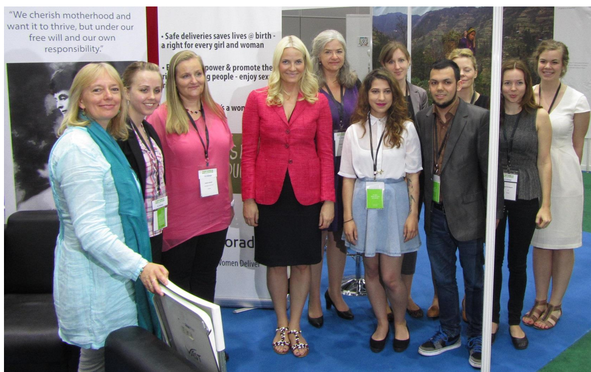
Kronprinsesse Mette-Marit og de norske deltakerne ved Women Deliver 2013