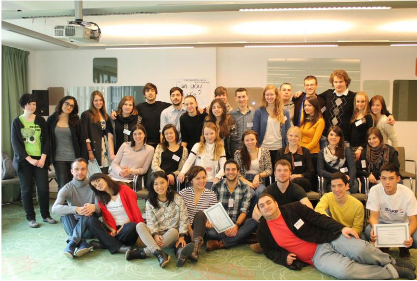
Deltakerne på YSAFE Annual Meeting 2013

Mange av deltakerne ble veldig motivert til å jobbe videre med disse problemstillingene i sine hjemland og respektive IPPF-organisasjoner, og spesielt mange var interessert i å gjøre noe med transsituasjonen i sine hjemland.