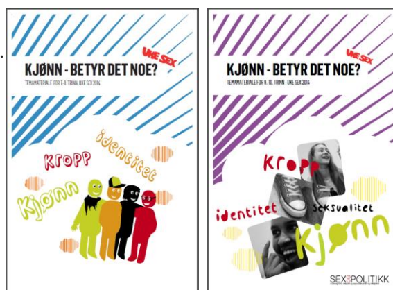
Temamateriale 7.-8. trinn (t.v.) og 9.-10. trinn

Du kan lese mer om Uke Sex og seksualundervisning, på www.ukesex.no