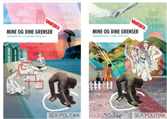
Temamateriale 7.-8. trinn (t.v.) og 9.-10. trinn

En årlig spørreundersøkelse sendes alle Påmeldte. Vi spør om bruk av Uke Sex Og tilfredshet med materialet. Undervisere svarer at de opplever Uke Sex 2013 som relevant, både i henhold til læreplaner og til elevenes alder og modenhet. Videre at materialet er enkelt å bruke og at øvelsene er gode. Enkelte kommenterer at Uke Sex har bidratt til bedre samarbeid med andre lærere på skolen. 65 prosent av underviserne som deltok i undersøkelsen ga Uke Sex 2013 toppkarakter (5 eller 6), og hele 97 prosent av underviserne ga Uke Sex 2013 karakteren 4 eller høyere. Over 90 prosent av underviserne oppga at de ville anbefale Uke Sex til sine kolleger. Dette viser at underviserne i stor grad er fornøyd med kvaliteten på materialet. Disse tallene har vært stabile over de tre første årene kampanjen har vært arrangert, og er en god indikator på at underviserne generelt er veldig fornøyd med Uke Sex.