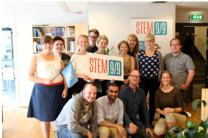
Medlemmer av LNUs AgFN