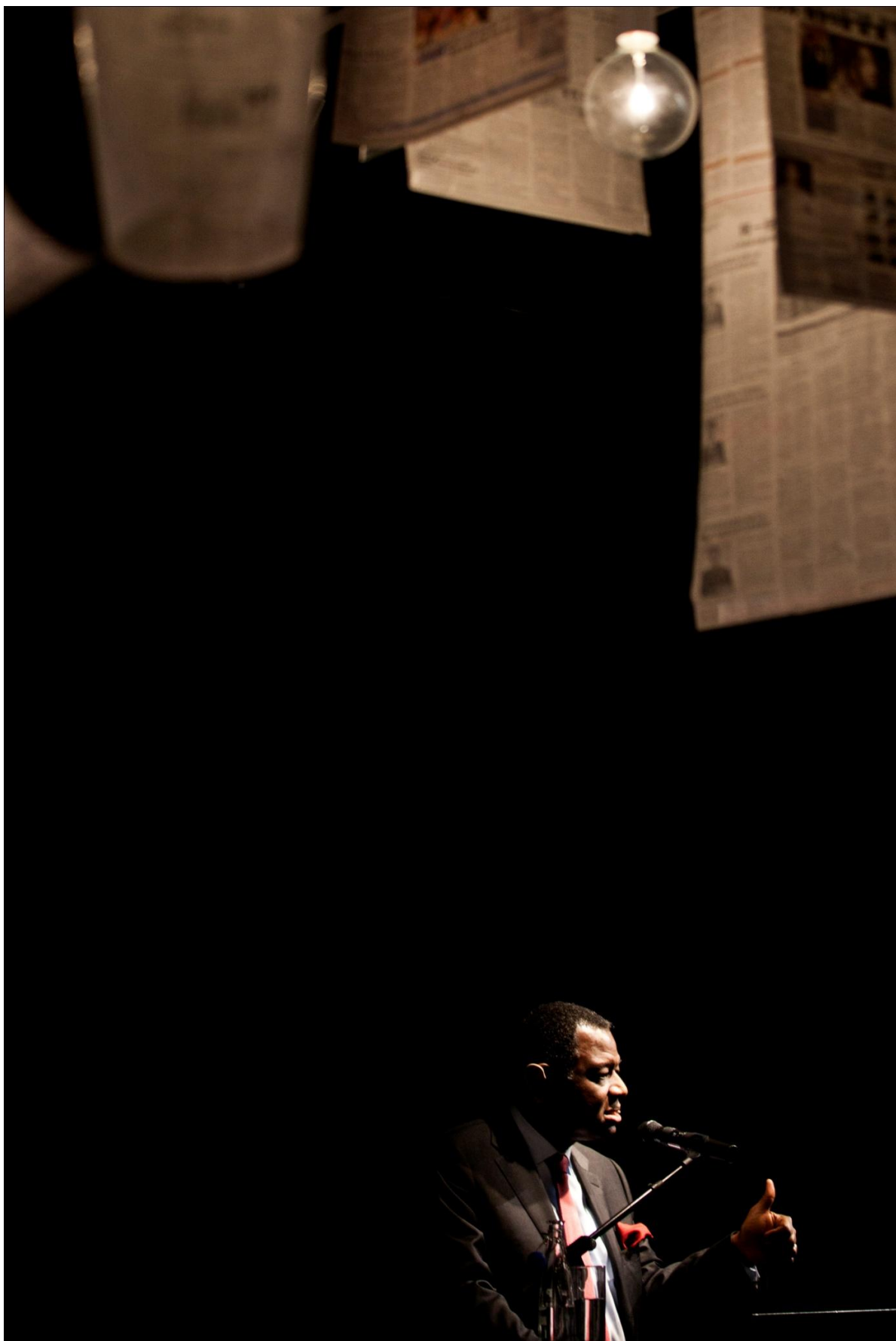
Morsdag på alvor: UNFPAs Executive Director Dr. Babatunde Osotimehin